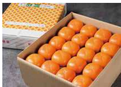
写真は2段約6.7kgの箱です