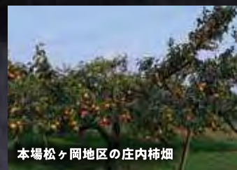
本場松ヶ岡地区の庄内柿畑